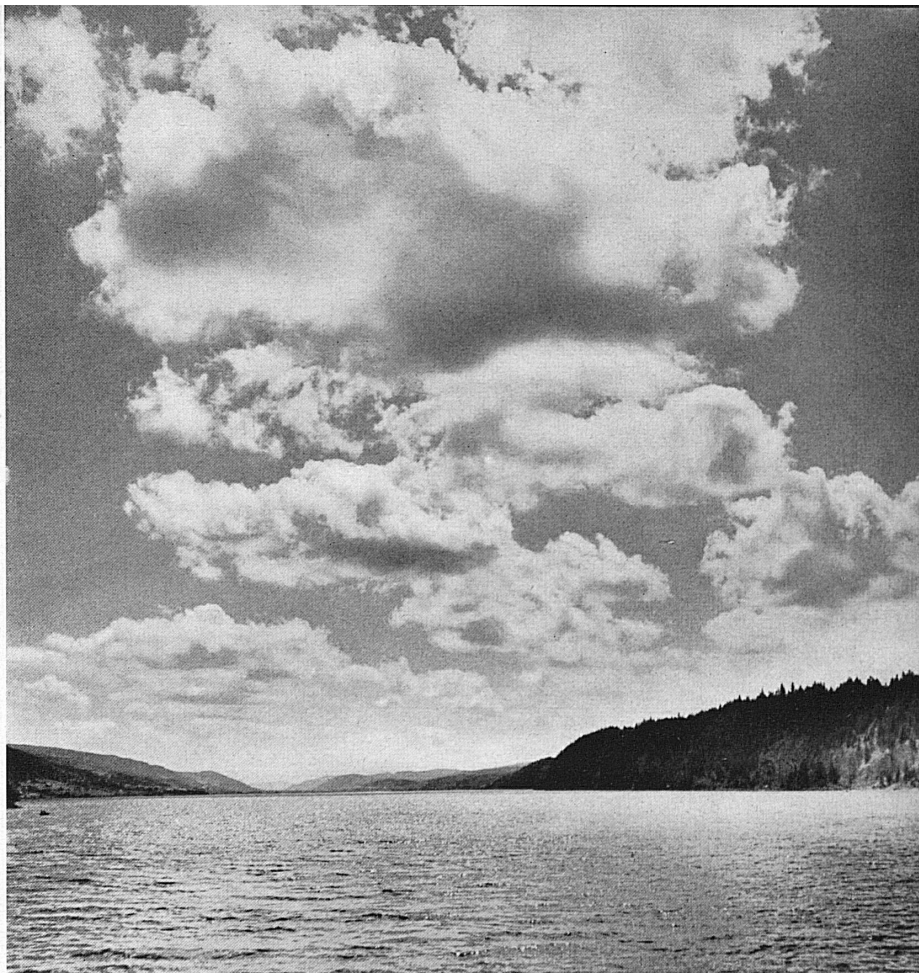
Am Lac de Joux.* Au bord du lac de Joux.