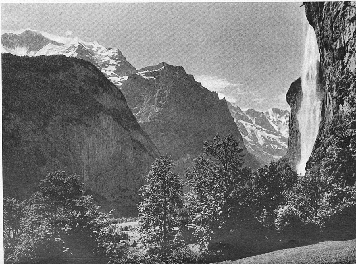
Der Staubbachfall bei Lauterbrunnen.* Le Staubbach.