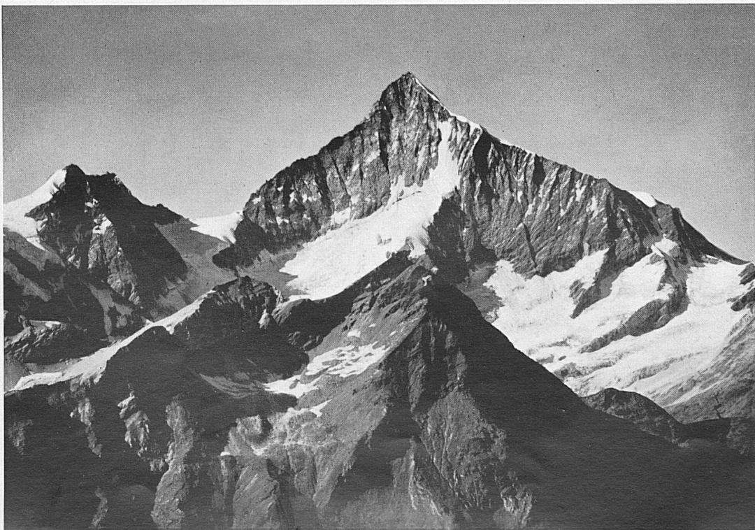
Schallhorn und Weißhorn vom Gornergrat aus gesehen.* Le Schallhorn et le Weisshorn vus du Gornergrat.