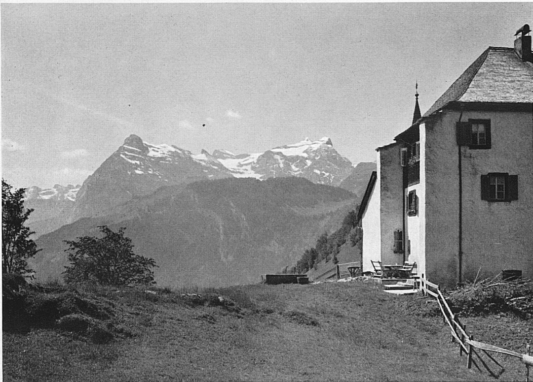
Jagdschlößchen Beroldingen und der Urirotstock.* Le pavillon de chasse de Berol- dingen et l'Urirotstock.