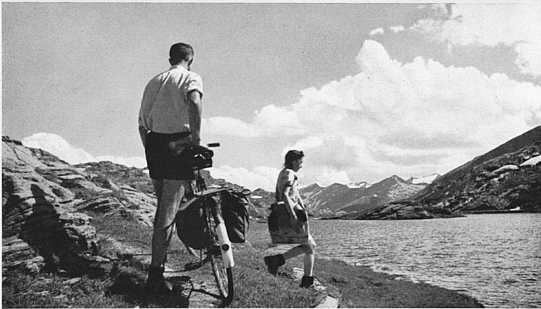
Der kleine Bergsee auf der Paßhöhe des San Bernardino.* Le petit lac au col du San Ber- nardino.