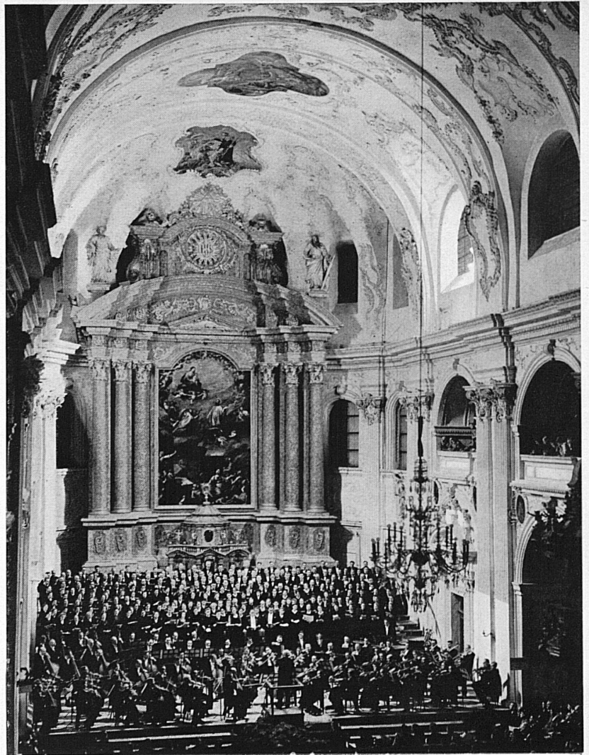
En haut: L'intérieur de l'église des Jésuites à Lucerne, où sera exécutée, le 4 septembre, la Missa solennis, de Beethoven. En bas: Walter Giesecking, Maria Caniglia, Ernest Ansermet, Antonino Votto, Paul Kletzki.