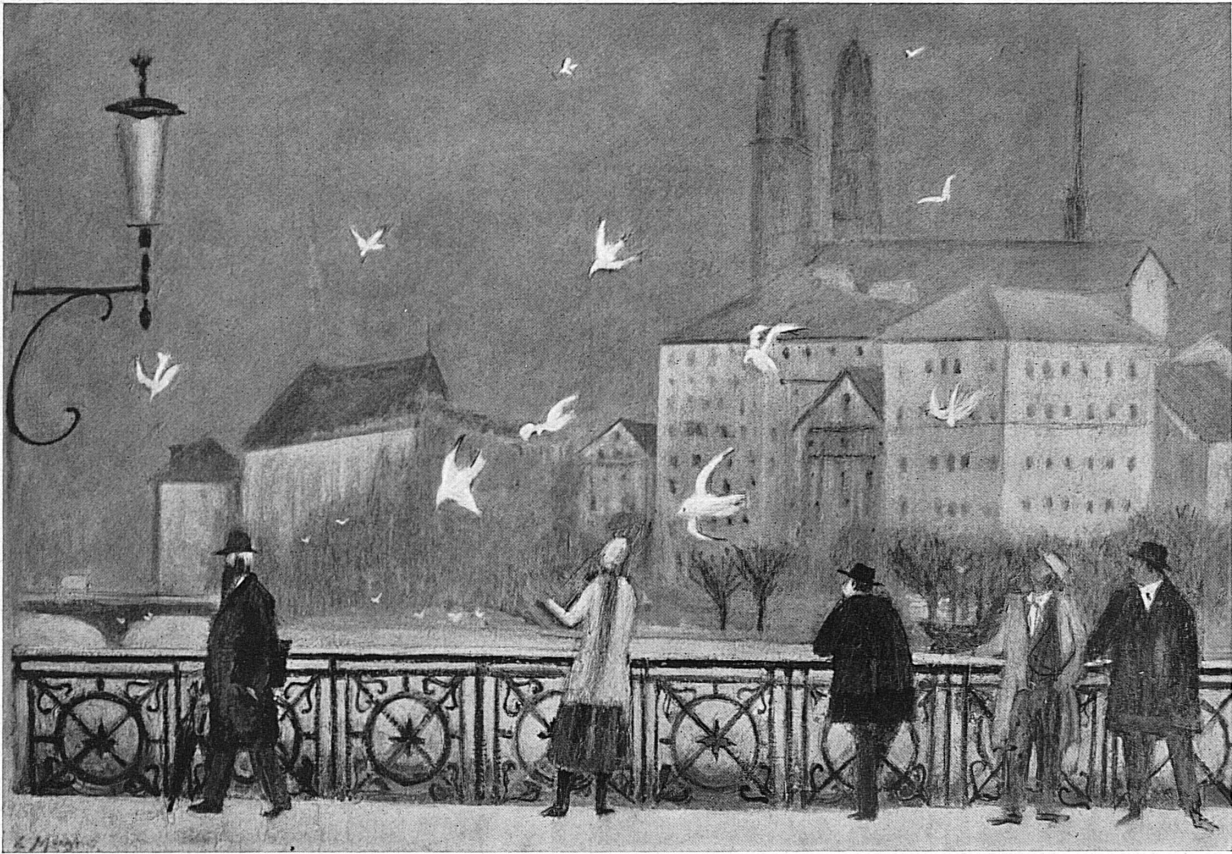
Zürich, Gemälde von Ernst Morgenthaler, im Besitz der Eidgenossenschaft, deponiert im Kunstmuseum Bern.