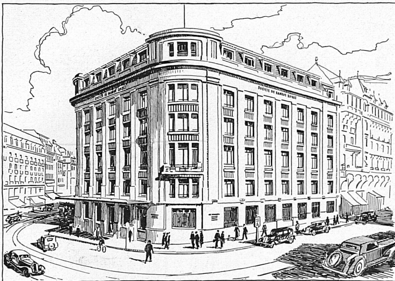
Hôtel de la banque à Genève — Bankgebäude in Genf