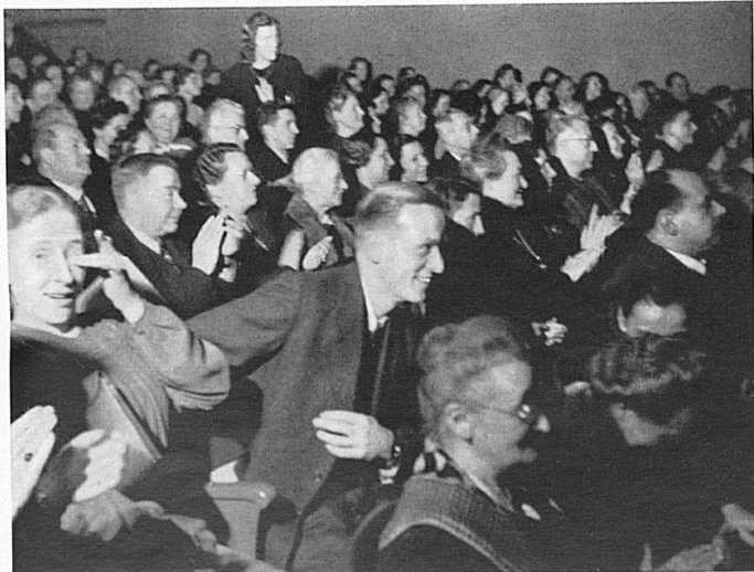
Das Publikum freut sich, freut sich von Herzen über den « Diener zweier Herren », der hier in des Wortes doppelter Bedeutung zweien Herren, sowohl der eigenen wie der gastgebenden Stadt, gleichermaßen dient. - Et les spectateurs se réjouissent de tout cœur des joyeuses péripéties de la comédie de Goldoni qu'ils ont le privilège de voir même loin de la métropole, grâce à cette tournée de représentations.

tigen zu tun; die Schauspieler müssen sich innert weniger Stunden von einem Klassiker auf ein modernes Lustspiel oder umgekehrt umstellen können. Und obendrein dürfen sie sich auf der Reise nicht erkälten.