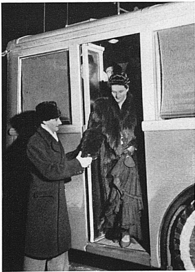
Unterdessen drängen sich bereits die Theaterbesucher im Foyer. Auch aus den Vororten und den umliegenden Gemeinden kommen sie mit Bahn, Tram und Trolleybus zur Aufführung. - Entretiens, les spectateurs se pressent au foyer du théâtre. Les trains, trams et trolleybus les ont amenés des environs vers la ville.

der Nachbarstadt untergeordnet und Winterthur, Schaffhausen, Olten, Thun und Aarau nicht als « geistige Provinz » der größeren Kulturzentren. Verzichteten sie auch auf ein ständiges eigenes Theaterensemble, so nehmen die Oltener — dank der regelmäßigen Gastspiele — doch regen Anteil am Theaterschaffen der Berner, die Aarauer an jenem der Basler, die Winterthurer und Schaffhauser an dem der Zürcher.