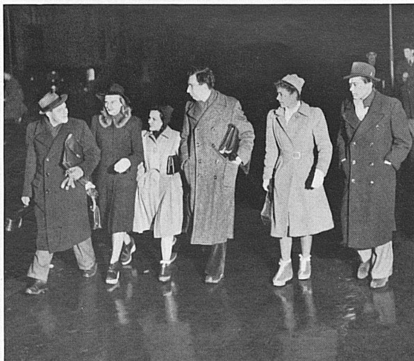
Gruppenweise geht's zum Nachessen. Es bleibt nicht mehr viel Zeit; denn auf das Umkleiden und Schminken muß die nötige Sorgfalt verwendet werden. - Par groupes, on s'en va dîner. Le temps presse, car les costumes et le maquillage demandent beaucoup de soin et de temps.

Der Mann, der im Jahre 534 v. Chr. in Athen die erste griechische Tragödie aufführte, hieß Thespis; aber sein Name wäre wohl längst vergessen, wenn nicht die Sage von ihm erzählen würde, er habe seine Stücke von einem Wagen herab dargestellt. Dieser Thespienkarren ist seitdem zu einem Begriff geworden. Noch heute — ja heute vielleicht mehr denn je — reisen die Nachfahren des Thespis, aber ihr Gefährt ist nicht mehr der Ochsenkarren, sondern das Auto, die Eisenbahn, der Dampfer und das Flugzeug. Sie reisen damit aber nicht nur von Kontinent zu Kontinent — von Frankreich nach Los Angeles, von Australien nach London, oder (in Friedenszeiten) von New York nach Berlin — auch innerhalb eines Erdteils selbst, ja innerhalb eines einzigen Landes, und sei es so klein wie die Schweiz, reisen sie von einer Stadt zur andern und geben sie ihre Gastspiele. Das ist bei uns nicht anders als in Deutschland, in England oder in Frankreich. Aber in einem unterscheiden wir uns von diesen Ländern ganz entschieden: bei uns « beehrt » nicht das Ensemble aus der Hauptstadt die « Provinz » mit seinem Besuch; denn in der Schweiz gibt es keine « Provinz » in des Wortes mitleidiger Bedeutung. Basler, Zürcher, Genfer, Berner, St. Galler, Luzerner haben ihre eigenen Theater und fühlen sich in keiner Weise — das ließe schon ihr Kantonalstolz nicht zu —