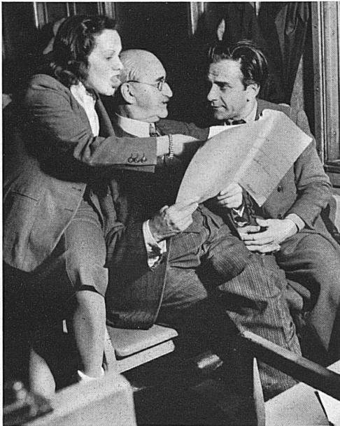
Ein Darsteller ist erkrankt und mußte in letzter Stunde ersetzt werden. Die Kollegen helfen in der Bahn beim Rollenstudium. - Un acteur doit remplacer en dernière heure son collègue tombé malade. Dans le train, ses camarades lui aident à préparer son rôle.

Der Mann, der im Jahre 534 v. Chr. in Athen die erste griechische Tragödie aufführte, hieß Thespis; aber sein Name wäre wohl längst vergessen, wenn nicht die Sage von ihm erzählen würde, er habe seine Stücke von einem Wagen herab dargestellt. Dieser Thespienkarren ist seitdem zu einem Begriff geworden. Noch heute — ja heute vielleicht mehr denn je — reisen die Nachfahren des Thespis, aber ihr Gefährt ist nicht mehr der Ochsenkarren, sondern das Auto, die Eisenbahn, der Dampfer und das Flugzeug. Sie reisen damit aber nicht nur von Kontinent zu Kontinent — von Frankreich nach Los Angeles, von Australien nach London, oder (in Friedenszeiten) von New York nach Berlin — auch innerhalb eines Erdteils selbst, ja innerhalb eines einzigen Landes, und sei es so klein wie die Schweiz, reisen sie von einer Stadt zur andern und geben sie ihre Gastspiele. Das ist bei uns nicht anders als in Deutschland, in England oder in Frankreich. Aber in einem unterscheiden wir uns von diesen Ländern ganz entschieden: bei uns « beehrt » nicht das Ensemble aus der Hauptstadt die « Provinz » mit seinem Besuch; denn in der Schweiz gibt es keine « Provinz » in des Wortes mitleidiger Bedeutung. Basler, Zürcher, Genfer, Berner, St. Galler, Luzerner haben ihre eigenen Theater und fühlen sich in keiner Weise — das ließe schon ihr Kantonalstolz nicht zu —