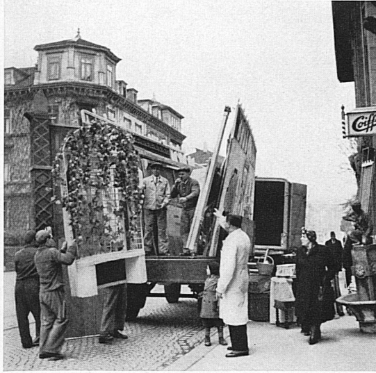
Dekorationen und Requisiten werden unterdessen unter Aufsicht des technischen Bühnenleiters frühzeitig und sorgfältig für die Fahrt verladen. - Cependant, les décors et accessoires sont expédiés avec soin et à temps, sous la surveillance du directeur technique de la scène.