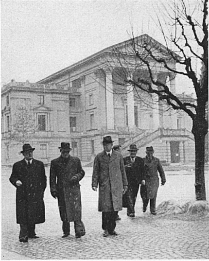
Auf dem Weg vom Stadthaus zum Theater des Gastortes besprechen die Leiter der einheimischen Bühne mit dem technischen Stab des Gastensembles, der vorausgefahren ist, die letzten Einzelheiten. - Chemin faisant, entre l'hôtel de ville et le théâtre du lieu de représentation, le directeur du théâtre de l'endroit discute les derniers détails avec l'équipe technique de la troupe en tournée.