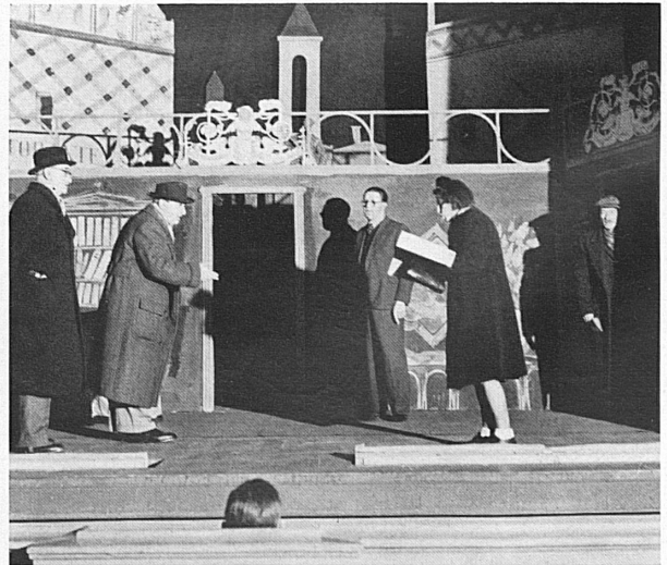
Eine Viertelstunde vor Beginn der Aufführung hält der Regisseur, noch in Hut und Mantel, mit dem Ersatzdarsteller eine Verständigungsprobe ab. - Un quart d'heure avant la représentation, le régisseur répète encore hâtivement le rôle avec l'acteur remplaçant au pied levé son collègue malade.