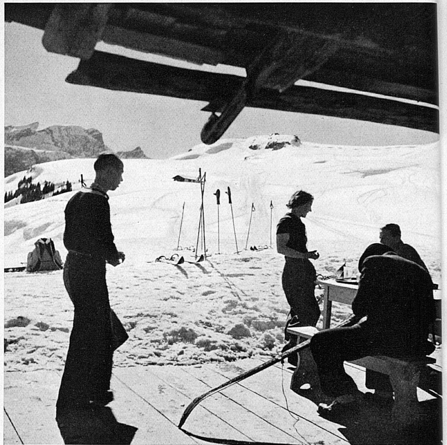
In der Lenk, im Gebiet der MOB.* — Au soleil de la Lenk, terminus du M. O.