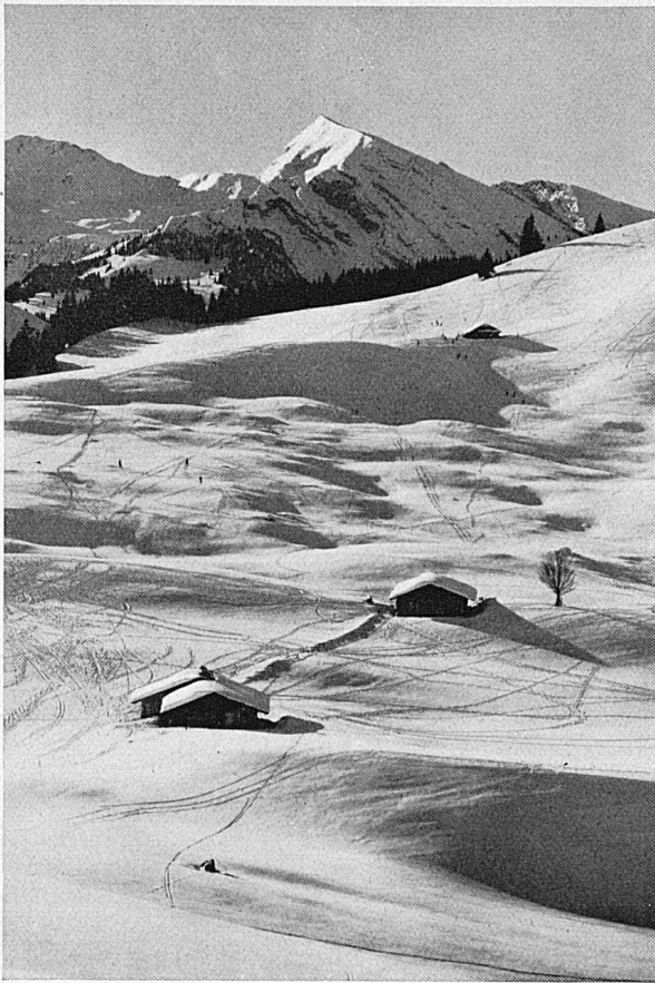
Tschuggenalp ob Dientigen.* — Tschuggenalp sur Dientigen, Simmental.