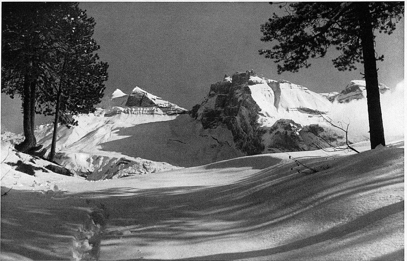
Im Lande der Lötschberg-Bahn ob Kandersteg. Blick auf Doldenhörner und Fisistöcke.* — Kandersteg, pays du B. L. S.: Doldenhörner et Fisistöcke.

die Drahtseilbahn Lauterbrunnen-Mürren. Während die BOB infolge des zunehmenden Winterverkehrs bereits 1893 Wagen anschafften, die extra für den Sommer- und Winterverkehr konstruiert worden waren, konnte sich die Lauterbrunnen-Mürren-Bahn erst 1910 zur Einführung des Winterbetriebes entschließen. Dafür brachte dann schon die Wintersaison 1912/13 die Eröffnung der elektrischen Seilbahn von Mürren auf den Allmendhubel, wodurch das Wintersportgebiet des rasch berühmt gewordenen Höhenkurortes noch besser zugänglich gemacht wurde. Mittlerweile hatte aber das seit 1893 durch die Wengernalp-Bahn mit Lauterbrunnen und Grindelwald verbundene Wengen ebenfalls lebhafte Anstrengungen zur Einführung der Wintersaison gemacht. Nach dem 1908—1910 mit großem Kostenaufwand erstellten Bau einer neuen, wintersüber weniger gefährdeten Teilstrecke konnte sich die WAB auch in den Dienst des rasch zunehmenden Wintersports stellen; 1912 fuhr sie im Winter erstmals bis zur Wengernalp, 1913 bis zur Kleinen Scheidegg, und seit 1933 besteht der durchgehende Winterverkehr Lauterbrunnen—Grindelwald. Hochalpines Skineuland erschloß sodann die 1896—1912 gebaute, höchstgelegene Bergbahn Europas, die Jungfrau-Bahn.