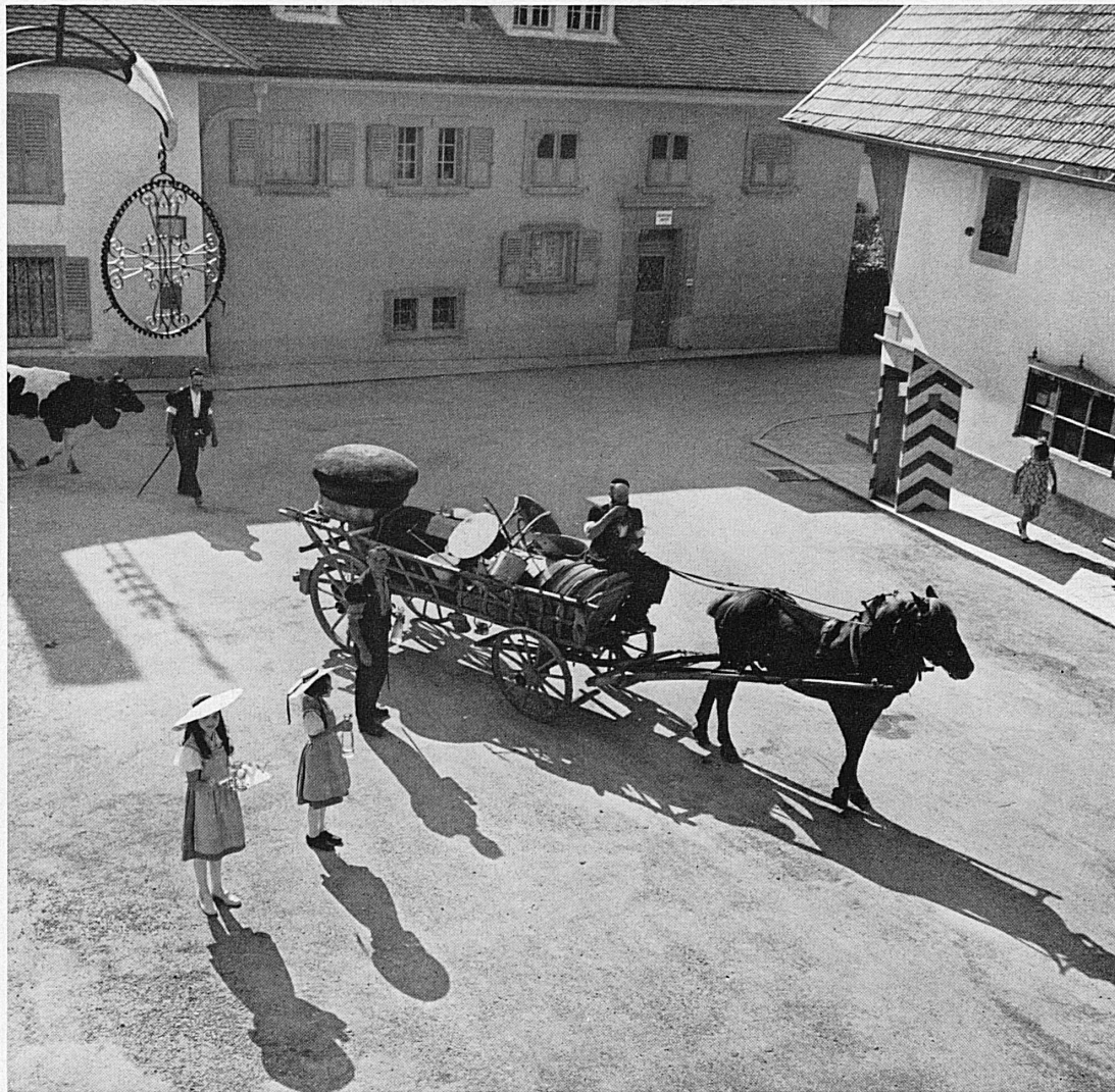
Une jolie tradition : la verrée offerte, sur la place du village, aux armaillis au moment où ils partent pour l'alpage. Ein hübscher Brauch : Der Trunk, der den Sennen vor der Alpfahrt geboten wird.