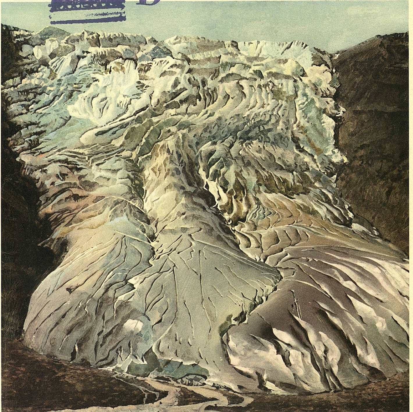
Hans Erni: Der Gletscher. Eine Gesamtausstellung im Luzerner Kunstmuseum vereinigt vom 6. August bis 24. September die Werke Hans Ernís Le Glacier. Une exposition réunit, du 6 août au 24 septembre, l'ensemble de l'œuvre de Hans Erni au Musée des Beaux-Arts de Lucerne

Sommer im Reich der Gletscher und Gipfel