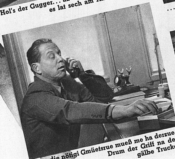
Aber die nöngi Gmüetsrue mueß me ha derzue. Drum der Griff na der gälbe Trucke.