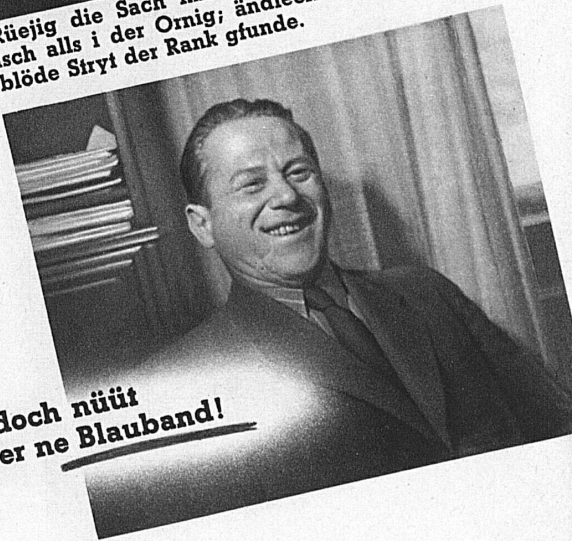
Es geit halt doch nüüt über ne Blauband!