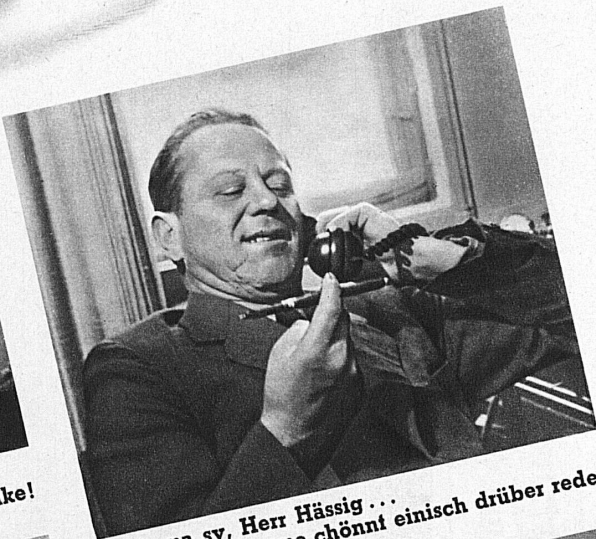
...s ma sy, Herr Hässig... me chönnt einisch drüber rede.