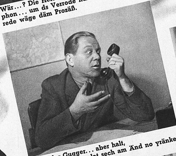
Hol's der Gugger... aber halt, es lat sech am Änd no yränke!