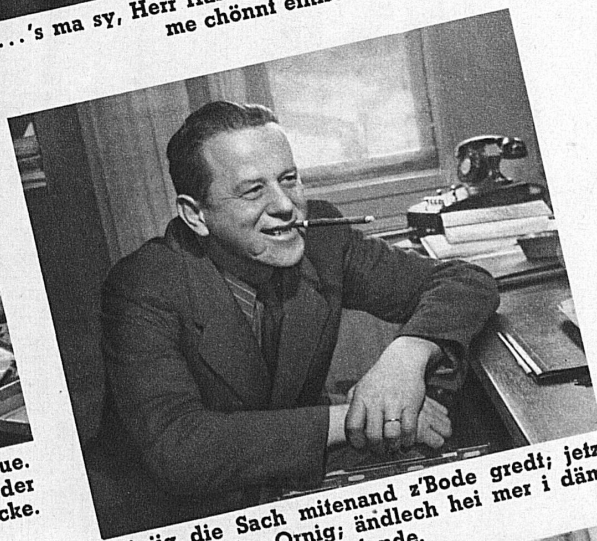
Rüejig die Sach mitenand z'Bode gredt; jetz isch alls i der Ornig; ändlech hei mer i däm blöde Stryt der Rank gfunde.