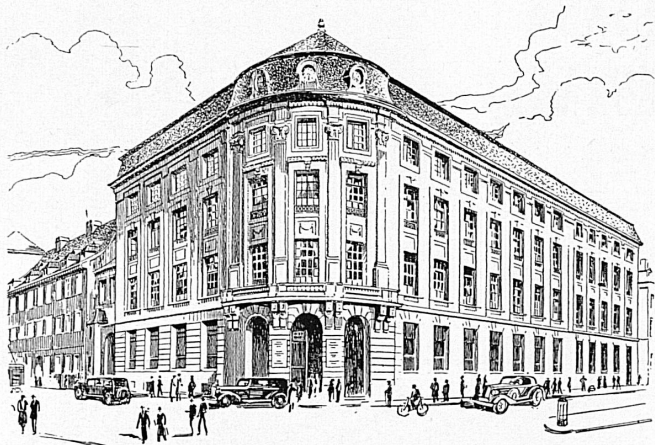
Bankgebäude in Basel — Hôtel de la banque à Bâle