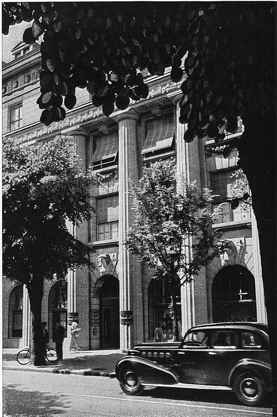
Eingang zum Bankgebäude in Zürich

Die mit * bezeichneten Aufnahmen behördlich bewilligt Nr. 6023 BRB 3. 10. 1939.