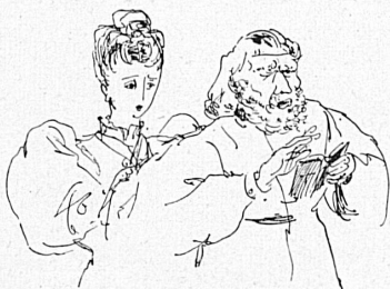
Zeichnungen von H. Steiner. Oben: «Und das Licht scheinete in der Finsternis», von Tolstoi, im Berner Stadttheater. Seite rechts oben: «Othello», von Verdi, im Basler Stadttheater. Mitte: «Die Fliegen», von Sartre, im Zürcher Schauspielhaus. Unten: Russisches Ballet, zur Aufführung des «Fürst Igor» von Borodin, im Zürcher Stadttheater.