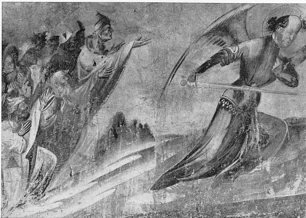
A gauche, en haut: Peintures murales dans l'église S. Nicolao à Lugano. En bas: Détail de fresques d'une église tessinoise près de Cevio. Page de droite, au milieu: Anges de l'église San Giorgio à Carona. En haut: Cloche de S. Abbondio. En bas: Coin idyllique à Brissago.

L'art baroque, comme on le voit, y dominerait, mais le plus souvent dans le visage accueillant de l'art populaire. L'académisme y serait volontairement omis. Je voudrais que cette image touffue rappelât au Tessinois en exil l'odeur des feux de broussailles au printemps, le goût âpre et doux du vin de nostrano , la tiédeur au toucher du granit sous le soleil d'hiver, le ruissellement constant de toutes les eaux qui sillonnent les vallées, le bruit des soques claquant dans les rues dallées du village, la profondeur si fraîche et si mystérieuse des rondes frondaisons sous lesquelles s'enfoncent les grotti , le charme de la sonorité saccadée du dialecte, et par-dessus tout, les carillons constants et égrenés de ces vieilles cloches au