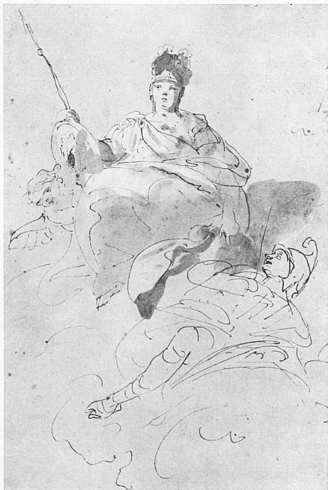
Disegno in penna di Giov. Batt. Tiepolo (1696—1770) esposto dal 28 aprile al 30 giugno nell'esposizione dei maestri italiani del disegno dal XV al XVIII secolo, organizzata dalla «Collezione grafica» del Pol. Fed. (da una collezione di un amatore svizzero dell'arte).

Federzeichnung von Giov. Batt. Tiepolo (1696—1770). Sie ist vom 28. April bis 30. Juni in der von der Graphischen Sammlung der ETH veranstalteten Ausstellung Italienscher Meisterzeichnungen des XV.—XVIII. Jahrhunderts (aus der Sammlung eines schweizerischen Kunstfreundes) zu sehen.