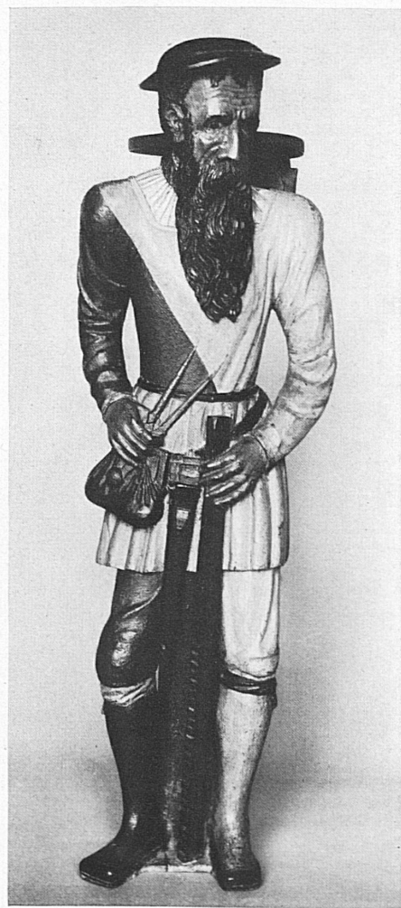
Statua-ritratto del mastro-artigiano Corrado Bodmer, del vecchio «Helmhaus» di Zurigo, 1564; nel Museo Nazionale svizzero.

Federzeichnung von Giov. Batt. Tiepolo (1696—1770). Sie ist vom 28. April bis 30. Juni in der von der Graphischen Sammlung der ETH veranstalteten Ausstellung Italienscher Meisterzeichnungen des XV.—XVIII. Jahrhunderts (aus der Sammlung eines schweizerischen Kunstfreundes) zu sehen.