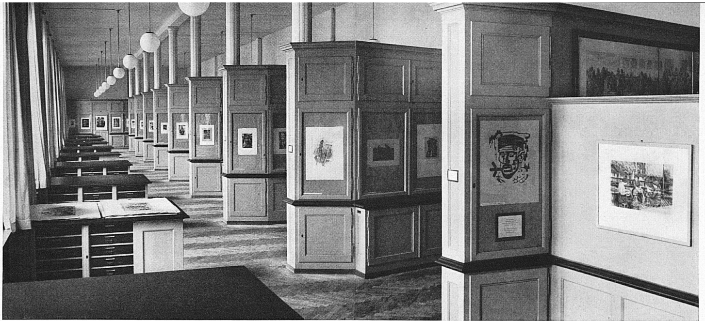
Le vaste sale per le esposizioni della «Collezione grafica» del Pol. Fed. a Zurigo nelle quali si alternano numerose le esposizioni.