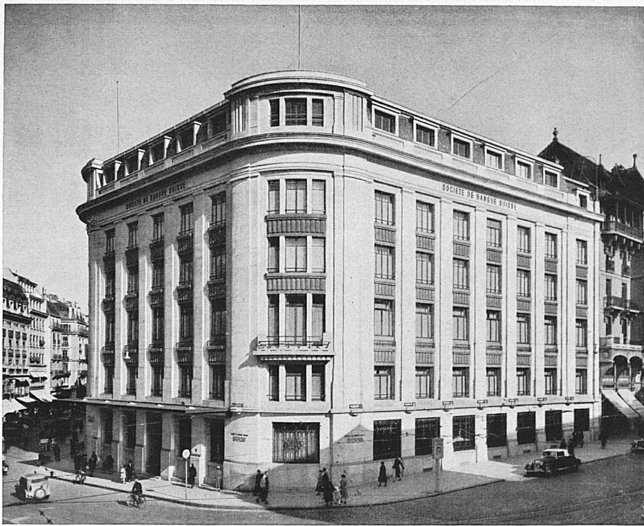
Hôtel de la banque à Genève - Bankgebäude in Genf