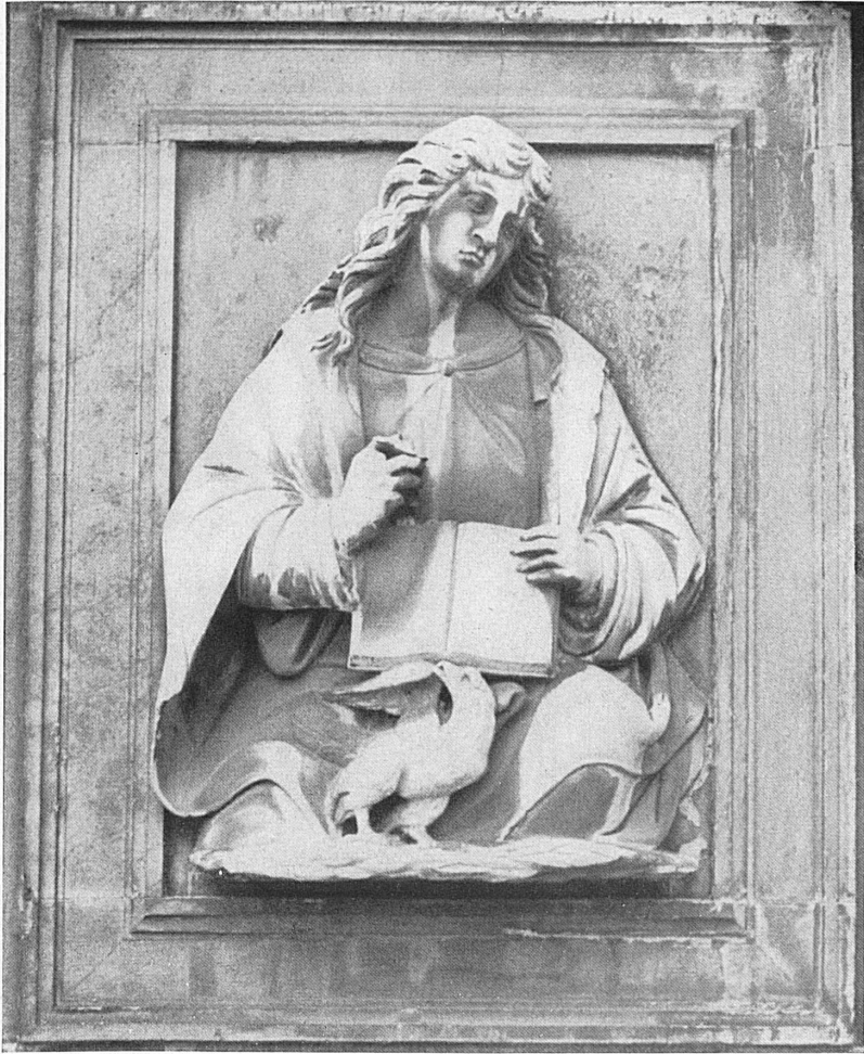
Relief an der Renaissance-Fassade der Kirche S. Lorenzo. — Bas-relief à l'église S. Lorenzo.