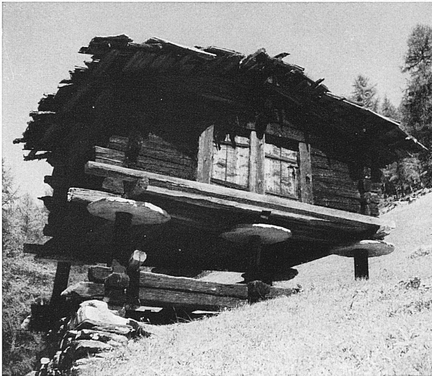
Walliser Speicher in Zinal. — Mazot à Zinal.