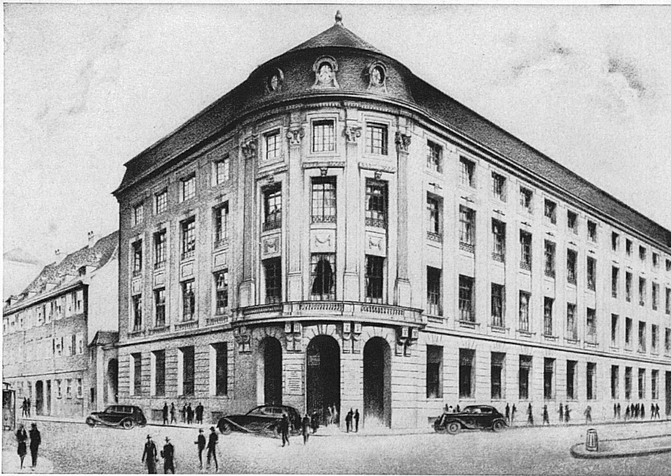
Bankgebäude in Basel - Hôtel de la banque à Bâle