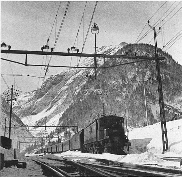
Gotthardzug in Göschenen. Le train du Gothard à Göschenen.

Verschiedene technische und bauliche Einrichtungen, die in jüngster Zeit geschaffen wurden oder vor naher Vollendung stehen, werden der Gotthardstrecke den Vorrang sichern, den sie als zugleich wichtigstes Glied des schweizerischen Bahnnetzes im Transitverkehr innerhalb unseres Kontinentes aufweist. Die bedeutsamste Neuerung ist ohne Zweifel das durchgehende zweite Geleise zwischen Arth-Goldau als dem nördlichen, Bellinzona als dem südlichen End- und Trennpunkt, das in wenig mehr als einem Jahr betriebsbereit sein wird.