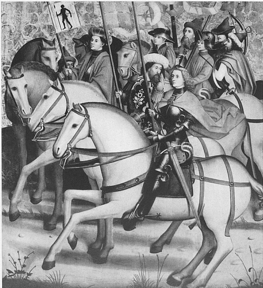
Links: Meister des Sterzinger Altars: Der Reiterzug der hl. 3 Könige. — Unten: Albrecht Dürer: Bildnis Michael Wolgemuts.