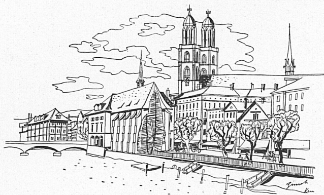
Zurich — Zürich. Dessins de Fritz Krummenacher.

von Strindberg und eine deutschsprachige Erstaufführung von T. S. Eliot, «Der Mord in der Kathedrale». An Gastspielen tritt das Theater in der Josefstadt mit dem «Talisman» von Nestroy und der Komödie «Olympia» von Molnár auf. Mehr kammerspielartig gestaltet sich Goethes «Stella» mit dem Burgtheater Wien. Besonders gespannt sein darf man auf die Freilichtaufführung von Shakespeares «Sommer-nachtstraum» mit der Musik von Mendelssohn im Park des Rietergutes (Villa Wesendonck).