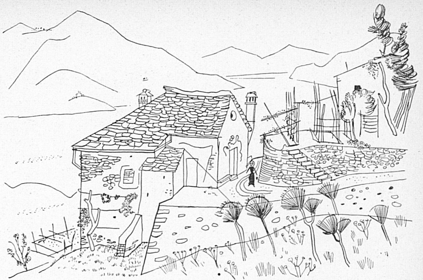
Oben: Ronco, hoch überm Ufer des Lago Maggiore.