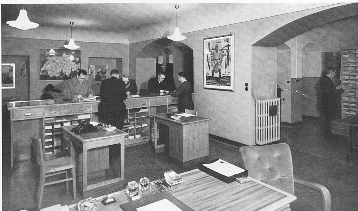
Der Auskunftsraum der Agentur Mailand in Via Dante 12. Comptoir de l'Agence de Milan, Via Dante 12.