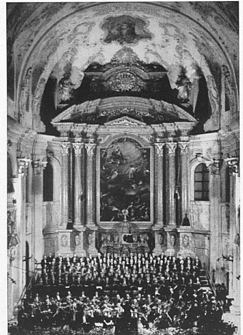
Oben: Unter der Direktion Wilhelm Furtwänglers wird in der Luzerner Jesuitenkirche Brahms' «Deutsches Requiem» erklingen. — Links: Aufnahme während eines Konzertes der letztjährigen musikalischen Festwochen. Paul Paray dirigiert das Luzerner Festspielorchester.

En haut: Le «Deutsches Requiem» de Brahms sera donné à l'Église des Jésuites de Lucerne sous la direction de Wilhelm Furtwängler.