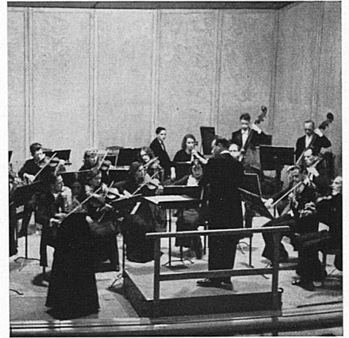
Links: Springbrunnen vor dem Kunsthaus Luzern. — Oben: In stimmungsvollen Serenaden vor dem Löwendenkmal wird auch diesen Sommer das ausgezeichnete Kammerorchester des «Collegium Musicum» unter Leitung von Paul Sacher zu hören sein.

A gauche: Jet d'eau devant le Kunsthaus à Lucerne. En haut: Cet été également, l'orchestre de chambre réputé du «Collegium Musicum» de Zurich se fera entendre dans plusieurs concerts devant le monument du Lion, sous la direction de Paul Sacher.