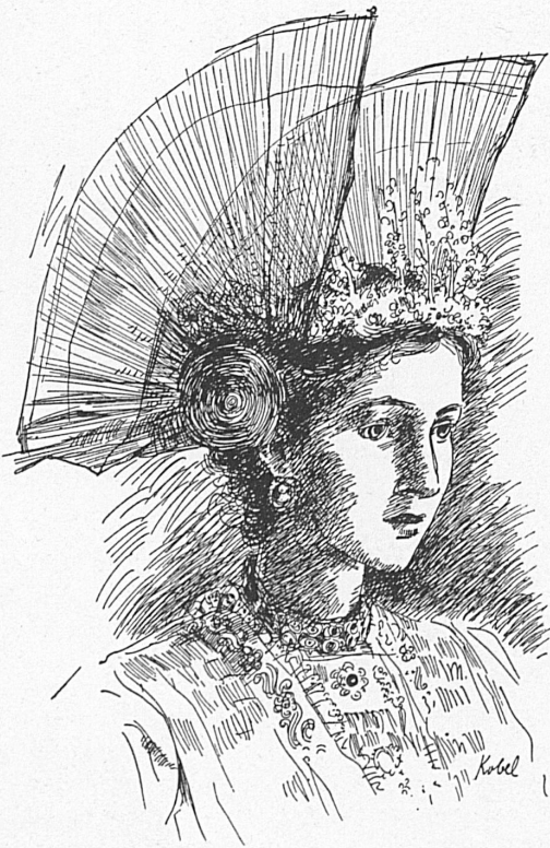
Tracht aus Innerrhoden.

Der Schweizer Held der Freiheit war und bleibt der Tell, und Arnold Winkelried mit seinem Opfertod steht neben ihm. Der heilige Klaus von Flüe aber wurde ihr Held der Liebe, die nach den Worten des Evangelisten das Größte ist unter ihnen.