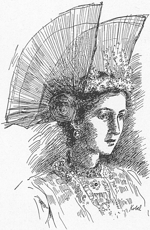
Tracht aus Innerrhoden.

Der Schweizer Held der Freiheit war und bleibt der Tell, und Arnold Winkelried mit seinem Opfertod steht neben ihm. Der heilige Klaus von Flüe aber wurde ihr Held der Liebe, die nach den Worten des Evangelisten das Größte ist unter ihnen.