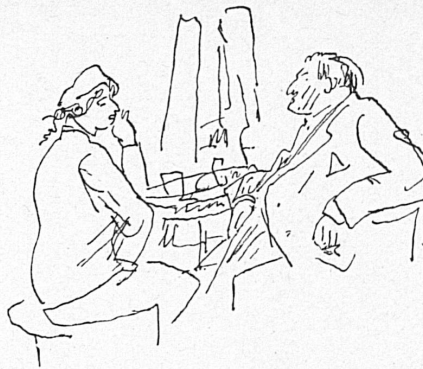
Zeichnungen von Victor Schwarz.

Alles mögliche gibt es im Bahnhofbuffet. Nur etwas gibt es dort nicht: Langeweile! Marc Voyageur.