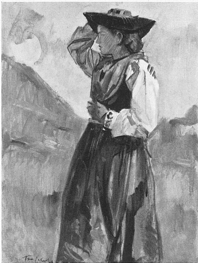
Walliserin in der Tracht. Valaisanne en costume.