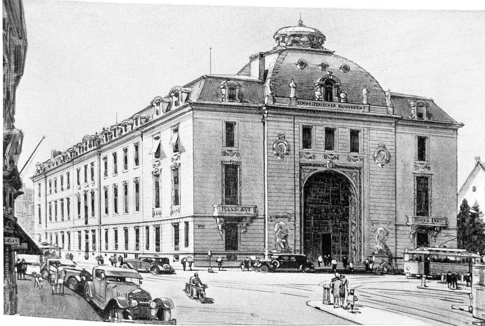
Bankgebäude in Zürich - Hôtel de la banque à Zurich