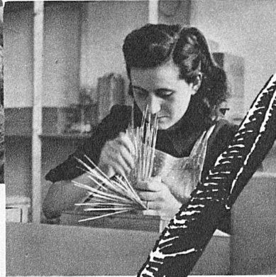
das richtige Hälmlí