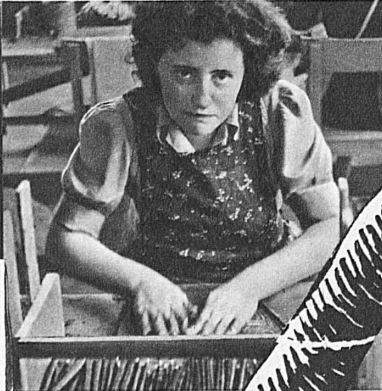
das richtige Deckblatt