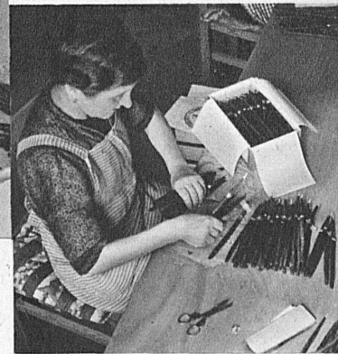
die richtige Verpackung

... der Fabbrica Tabacchi in Brissago Blauband Brissago