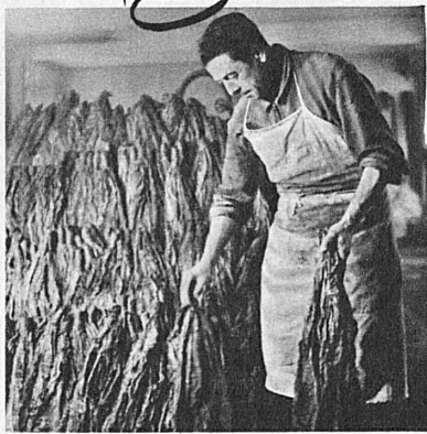
der richtige Tabak