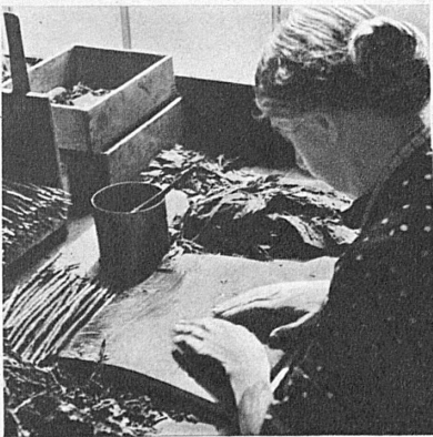
die richtige Einlage