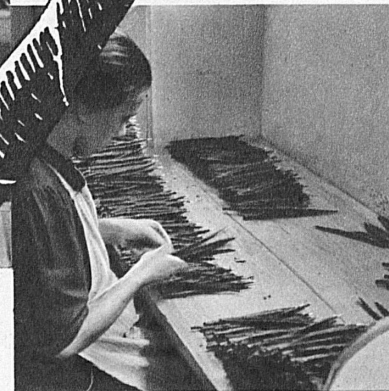
die richtige Kontrolle