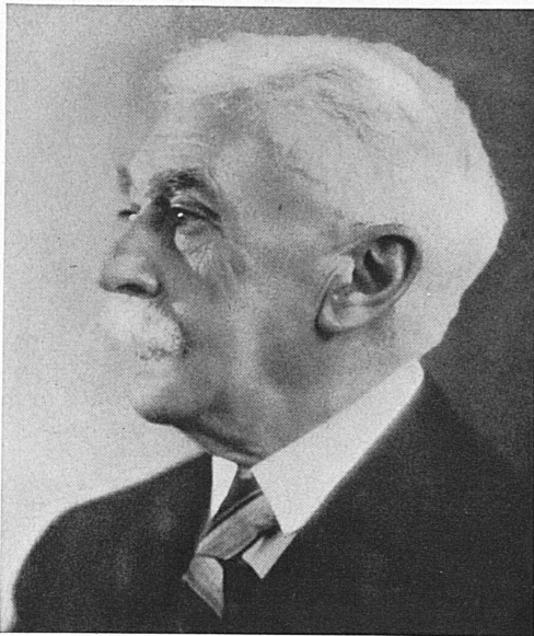
Le baron Pierre de Coubertin, rénovateur des Jeux olympiques, mort à Genève le 2 septembre 1937.