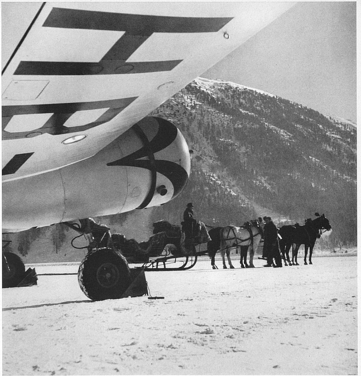
Oben: Alte und neue Zeit treffen sich auf dem Ober-Engadiner Flugplatz zu Samedan, wo die mit dem Flugzeug ankommenden Gäste in bequeme Zweispänner-Schlitten umsteigen können. — Unten, von links nach rechts: Die Rhätische Bahn wird die Hauptzahl der Teilnehmer und Zuschauer ins Engadin führen. — Die Autostraßen über den Julier, die Maloja und den Ofenberg werden auch im Winter offengehalten. — Blick aus der Vogelschau auf den Ober-Engadiner Flugplatz Samedan.