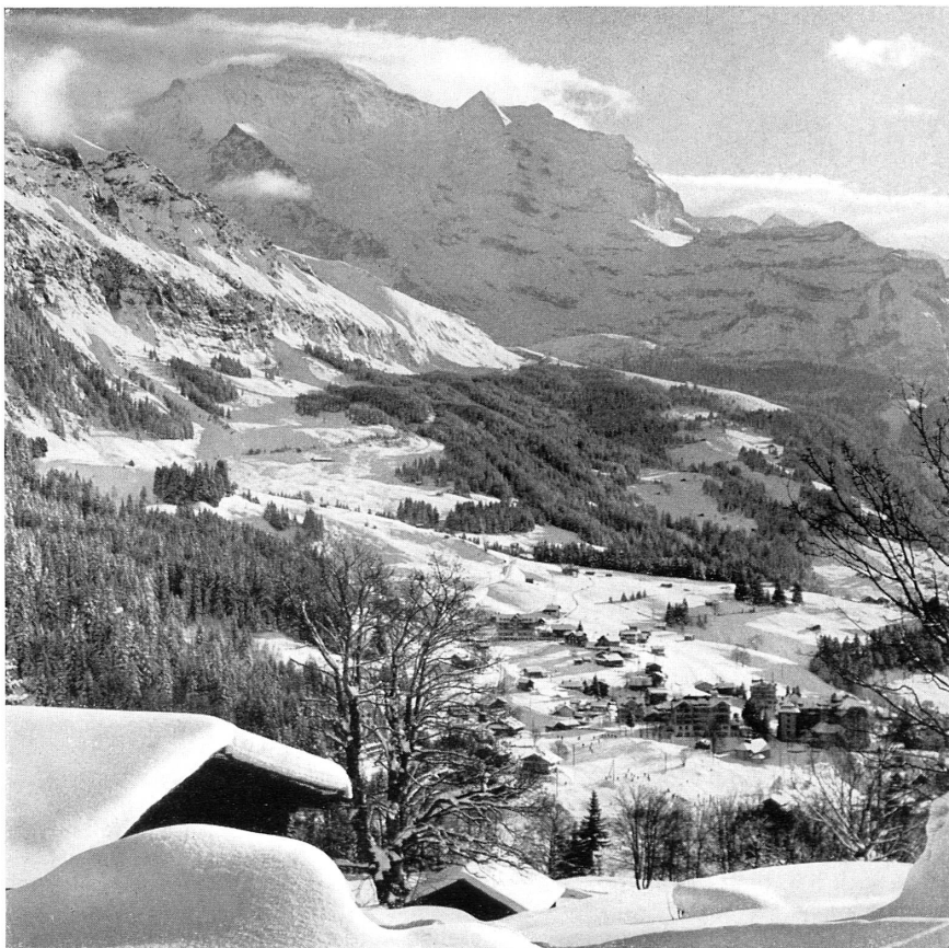
Oben: Blick auf Wengen, gegen die Wengernalp und die Jungfrau. — Unten: Die Abfahrt von der Wengernalp. — En haut: Vue sur Wengen, du côté de la Wengernalp et la Jungfrau. — En bas: Descente de la Wengernalp.