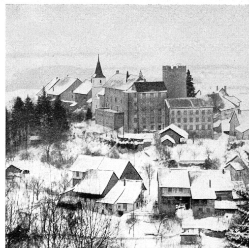
Regensberg, im Zürcherland, ein mittelalterliches Miniaturstädtchen im Winter.

Le château moyenâgeux de Steckborn (lac de Constance) avec ses imposantes poivrières aux campaniles de style baroque, construites au XVII me siècle.