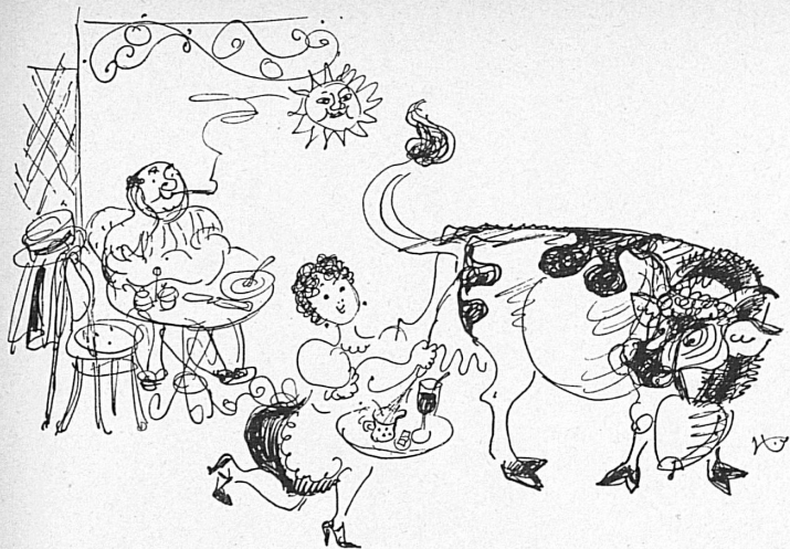
Gasthof zur Sonne. L'auberge du soleil.

Auf diesen beiden ebenso prächtigen wie verständlichen Grundsätzen fußt eine der größten schweizerischen Industrien — nach Ansicht eines Laien, der sich immerhin vor einigen Jahren in Gedanken damit befaßte, persönlich diese Bestrebungen zu unterstützen.