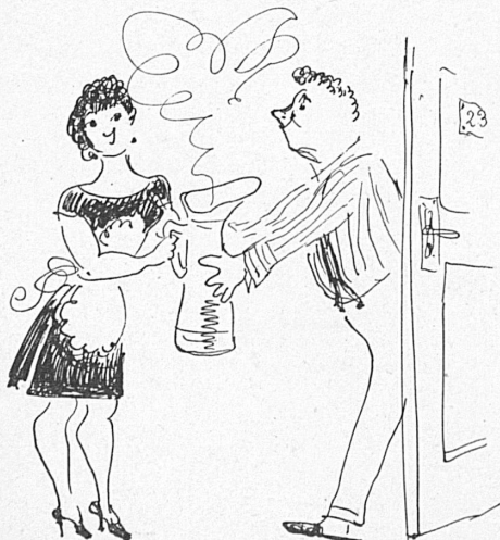
Rösi bringt das Warmwasser ins Zimmer. «Rösi» apporte l'eau chaude.

Versteht man wohl, was ich damit sagen will? Ist es wohl klar, daß unser Gast, ob er viel oder wenig zahlt, ob er im Grand-Hotel Bellevue oder bescheiden im Gasthof zur Sonne absteigt, nicht nur Nr. 17 oder Nr. 519 ist, sondern eben ganz individuell und persönlich behandelt wird?