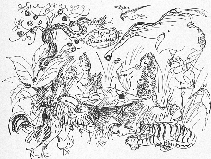
Oben: Hotel «Paradies». — Unten: «Hospiz». En haut: L'hôtel «Du Paradis». — En bas: L'hospice.