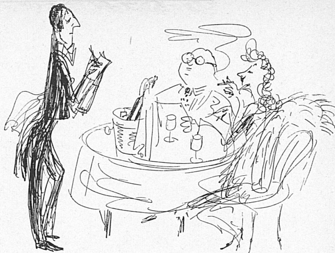
Grand-Hotel Bellevue. Grand-Hôtel Bellevue.

Gelegentlich wird im Ausland — etwa in einer internationalen Revue — der Vertreter der Schweiz ganz einfach als «Hotel-Portier» dargestellt. Und es kann passieren, daß ein empfindlich besaiteter Schweizer, der diesen «Hotel-Portier» sieht, sowohl in seinem persönlichen wie in seinem eidgenössischen Empfinden sich beleidigt fühlt und Krach schlägt. Über seine Freunde, über die Presse, falls möglich sogar über Konsulate und Gesandtschaften. Mir ist der «Hotel-Portier» mit der Marke «Bellevue», oder ganz schlicht «Gasthof zur Sonne», tausendmal lieber als das «Sinnbild der Schweiz» in kurzen Lederhosen und mit einem Gamsbart auf dem Lodenhüterl, wie man es in eben einer solchen Zeitschrift zuweilen erblickt! Daß man