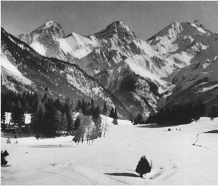
Das Skigelände der Lenzerheide mit Aussicht gegen die Bergünnerstöcke. — La région de ski de Lenzerheide avec vue sur les Bergünnerstöcke.