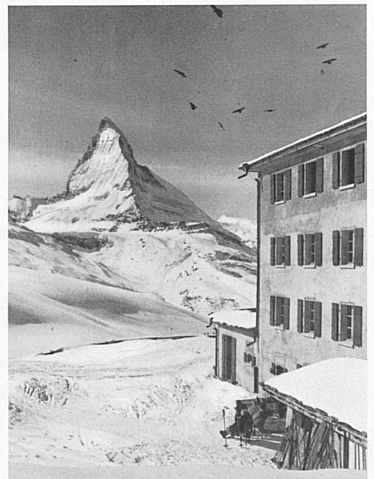
En haut : L'Hôtel Riffelberg et le Cervin. — Oben: Das Riffelberg-Hotel mit dem Matterhorn.

A gauche : Coup d'œil du Schwarzsee sur le Riffelberg et la contrée du Gornegrat; au fond, le Mont Rose. — Links: Blick vom Schwarzsee aus ins Riffelberg- und Gornegratgebiet; im Hintergrund der Monte Rosa.