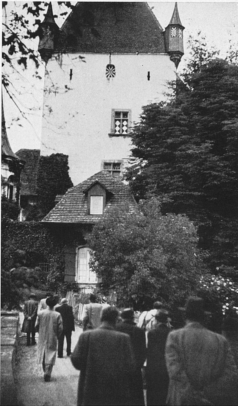
Oben und rechts unten: Das Schloß Worb bei Bern ist als künftiger Sitz des europäischen Burgenforschungsinstitutes ausersehen. Die prächtig gelegene, große Burg stammt in den ältesten Teilen aus dem 12. Jahrhundert und hat eine interessante, wechselvolle Geschichte. — En haut et à droite en bas: Le château de Worb, près de Berne, est destiné à devenir le siège futur du Centre européen d'études pour les châteaux. Le grand château fort magnifiquement situé, et dont les plus anciennes parties datent du 12 me siècle, a une histoire très mouvementée.