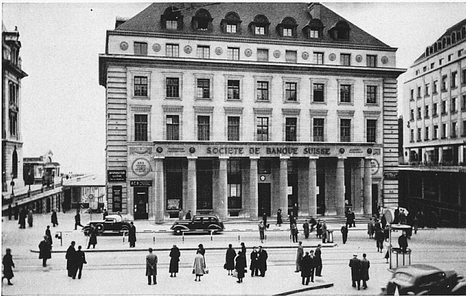
Hôtel de la banque à Lausanne