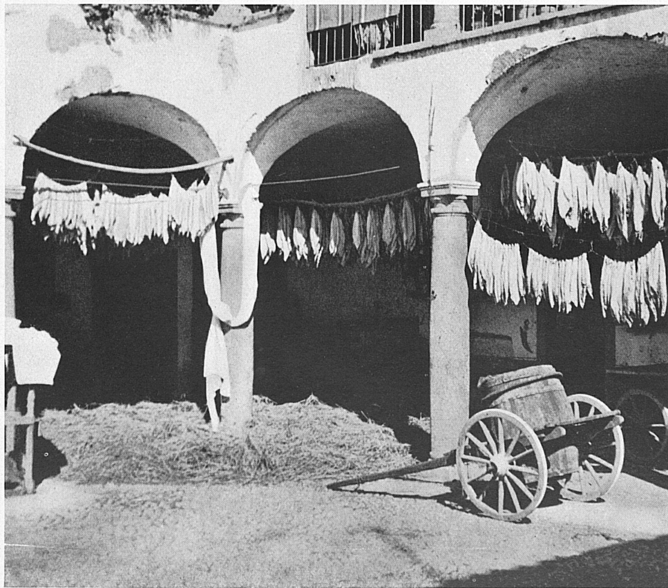
A gauche: Les arcades de cette ferme tessinoise sont utilisées comme lieu de séchage des feuilles de tabac. — Links: Der Bogengang als Tröckneraum für den Tabak. Hof eines Bauernhauses im Mendrisiotto.

On n'apprécie pourtant pas le Mendrisiotto dans tout son charme particulier si l'on se borne à traverser la plaine. Les paysages et les villages des collines valent la peine d'une visite. Voyez par exemple sur les pentes du San Giorgio le charmant village de Méride, avec ses exquises vieilles demeures, ses balcons à balustrades de fer forgé qui dessinent de fines arabesques. Ce sont les témoins d'une époque de bien-être et de goût, comme aussi les maisons de style de Ligornetto, patrie du sculpteur Vincenzo Vela; l'architecture particulière de ce bourg et sa situation pittoresque le rendent fort attachant. De l'autre côté de la vallée, Morbio Superiore et l'arc de son viaduc; l'idyllique petite église de San Martino dans son cadre de