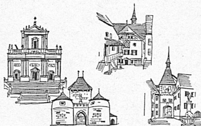
Dessin de F. Krummenacher.