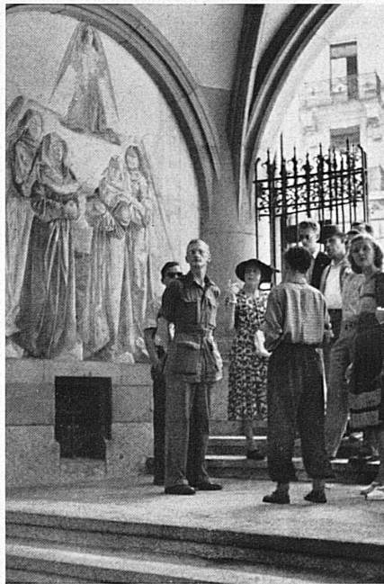
Above: The first afternoon finds small groups of students out sightseeing in the Old Quarter of Zurich. For obvious reasons Charlemagne proves less interesting to the agricultural engineer from Minnesota than to his colleagues of the Philosophical Faculty of Oxford or Heidelberg.