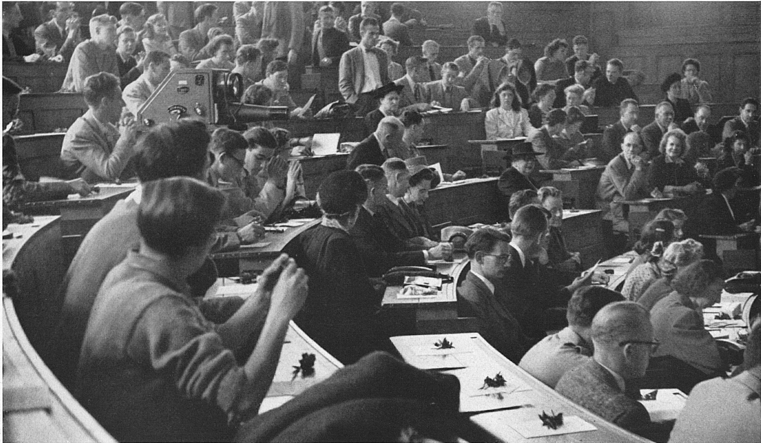
Above: At the inaugural ceremony, students meet their professors, representatives of the university, and the authorities. Switzerland greets them with pretty rhododendrons. — En haut: La séance d'ouverture réunit les participants, les professeurs et les représentants des universités. Un petit bouquet de rhododendrons, déposé sur les pupitres, apporte à chacun la bienvenue du pays. — Oben: Eine Eröffnungsfeier vereinigt jeweils die Teilnehmer mit ihren Professoren, mit den Vertretern der Hochschulen und der Behörde. Den Gruß des Landes aber vermittelt ein bescheidenes Alpenrosenzweiglein.