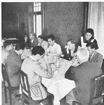
Below: Britons, Americans, Germans and Swiss, all registered in the Political Science Department, sit together at the same table in a Zurich boarding house where they find that Germans can speak very good English and Americans quite understandable German.—On excursions and at the ever popular evening parties they find ample opportunity to get better acquainted. — En bas: Les repas réunissent autour d'une même table des étudiants anglais, américains, allemands et suisses, tous inscrits au « Political Science Department ». La différence de langue n'est pas un obstacle à la compréhension mutuelle: les Allemands s'expriment souvent en un anglais correct et les Américains en un allemand très intelligible. — Les excursions et les soirées dansantes facilitent les rapprochements et permettent à chacun de se mieux connaître et de s'apprécier. — Unten: In einer Zürcher Pension sitzen Engländer, Amerikaner, Deutsche und Schweizer, alle im « Political Science Department » eingeschrieben, am selben Tisch. Dabei stellt sich heraus, daß Deutsche sehr wohl ein gutes Englisch und Amerikaner ein ganz verständliches Deutsch zu sprechen verstehen. — Auf Exkursionen, oder dann an einer der beliebten Abend-Parties, ist viel Gelegenheit geboten, sich besser kennen und schätzen zu lernen.