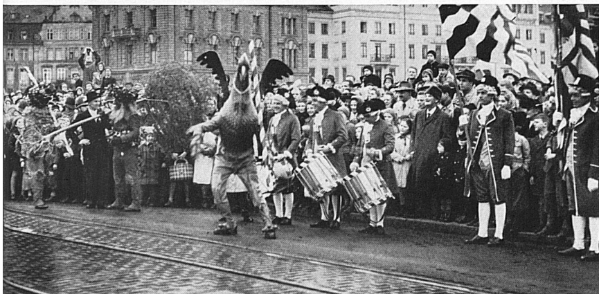
Unten: Der «Wilde Mann», von den Schulbuben geneckt, netzt sein Tännchen in einem Brunnen und jagt den davonstürmenden Knirpsen nach. So geschieht es immer wieder beim nachmittäglichen Umzug durch die Straßen der «minderen Stadt». — En bas: Le «Sauvage» harcelé par des écoliers trempe son sapin dans une fontaine et chasse ces bouts d'homme qui s'enfuient précipitamment.