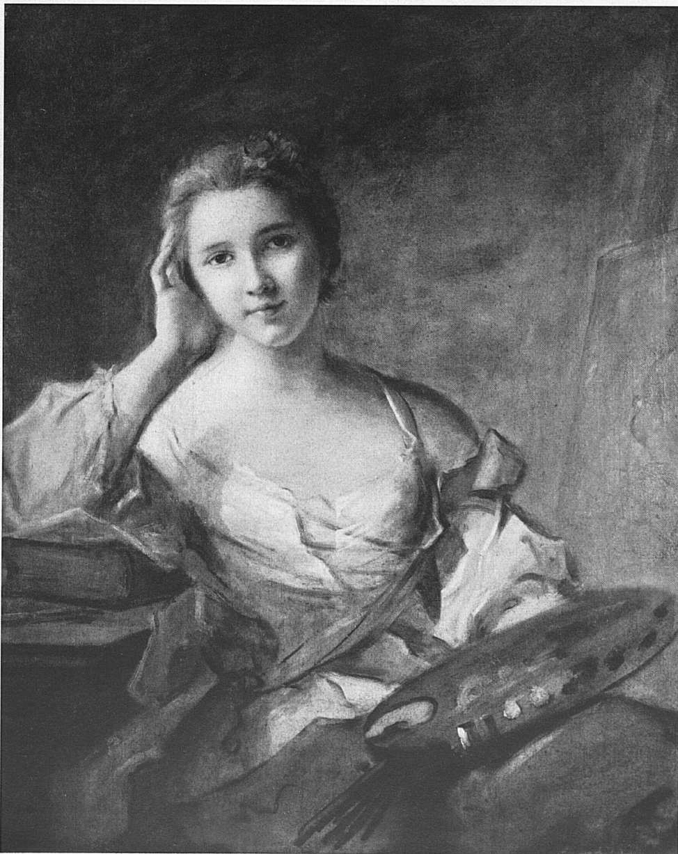
A gauche: J.-M. Nattier: Portrait d'une femme peintre (Musée de Metz).