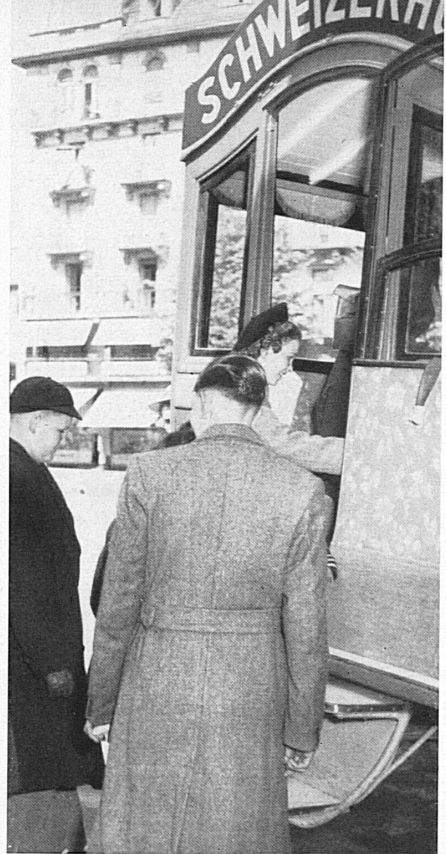
... and you get to the "Schweizerhof". — ... und Ihr kommt in den « Schweizerhof ».