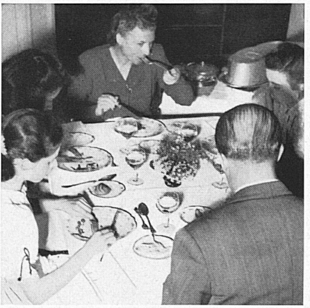
At lunch in the Palace Hotel. — Beim Mittagessen im Palace Hotel.

Amusements provided for the children during their stay in Switzerland included the most beautiful excursions in the Alps, as well as all kinds of young people's entertainment. After a month of rest, healthful play, fresh air and sunshine, the young guests returned to England much improved from their Swiss holiday.