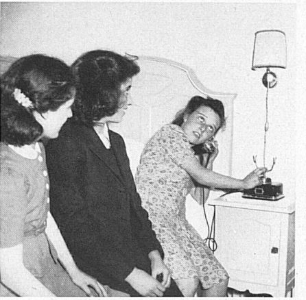
Yes, the room telephone really works. — Tatsächlich, es geht, das Zimmer-telephon!