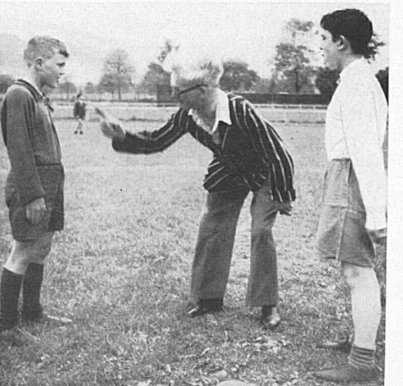
Final instructions for the football match with the Lucerne junior team. — Letzte Instruktionen für den Fußballmatch mit der Luzerner Jungmannschaft.