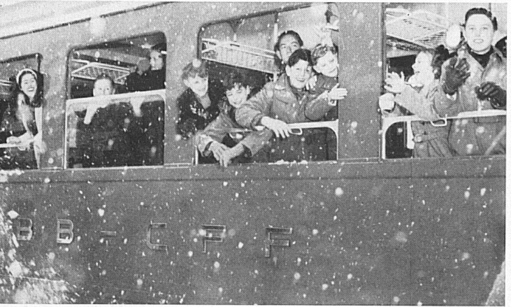
The "Red Arrow" takes the young guests up the St. Gotthard Pass. In Göschenen, real, clean, white snow means fun aplenty. — Mit dem Roten Pfeil nach dem St. Gotthard War das ein Spaß, richtiger, reiner, weißer Schnee in Göschenen!