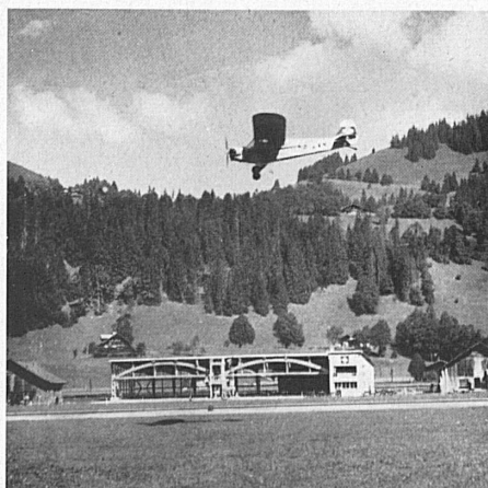
Mit einem gut gelungenen Flugtag wurde der neue Flugplatz von Saanen eingeweiht, der dank seiner landschaftlichen Reize regen Besuch erhalten dürfte. Der neue Hangar weist eine Breite von 40 und eine Höhe von 10 m auf. — L'aérodrome de Gessenay a été inauguré au cours d'une journée d'aviation très réussie. Nul doute que le charme du paysage n'y attire de nombreux aviateurs. Le nouveau hangar mesure 40 m. de large et 10 m. de haut.