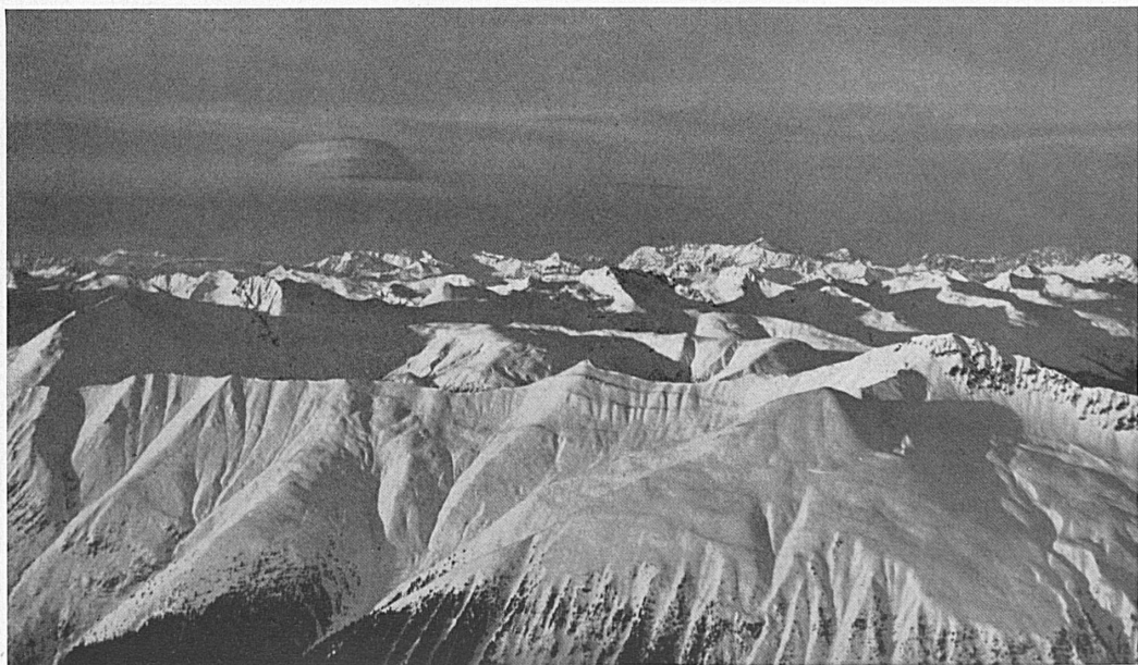
Unten: Die Mittelbündner Gebirgswelt zwischen Bergün, Davos u. Arosa. Die hohe Kette im Hintergrund ist der Rhätikon, mit der Scesaplana als Hauptgipfel. — In basso: Il gruppo centrale delle montagne grigionesi fra Bergün, Davos e Arosa.

noch sei hier einmal versucht, einige der herrlichen Eindrücke wiederzugeben, die ein Flug über die Gebirgswelt hin vermittelt. Die Bilder werden manchen unserer Bergfreunde und Ski-enthusiasten gerade wegen der weiten Übersicht interessieren und freuen, die sie über die komplizierte Bergwelt des Landes der 150 Täler zu geben vermögen.