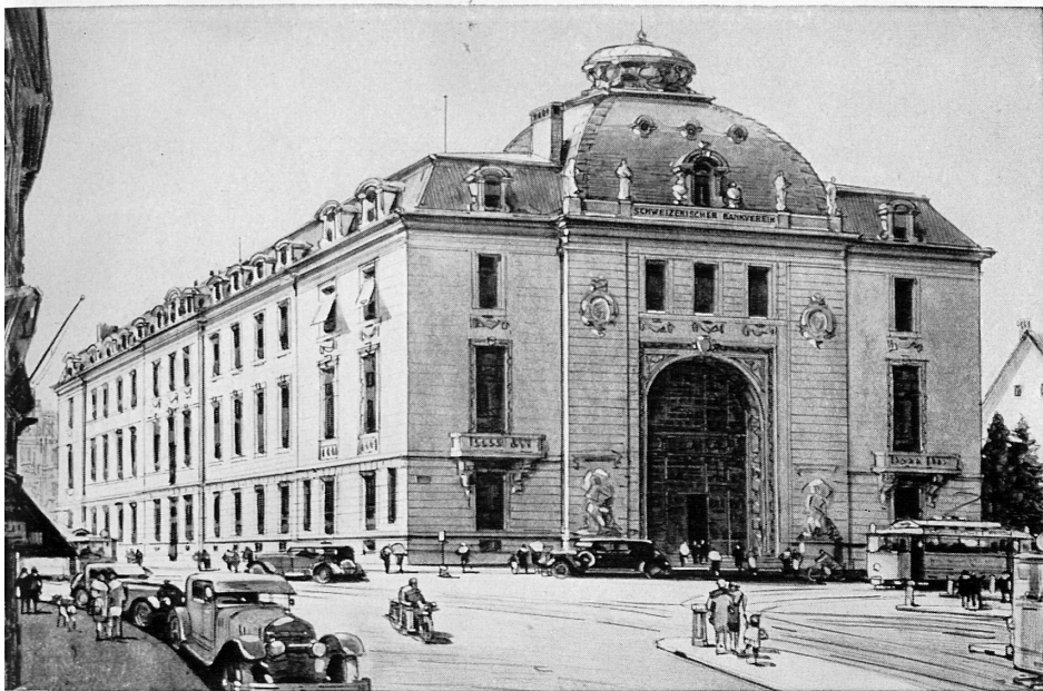
Bankgebäude in Zürich - Hôtel de la banque à Zurich