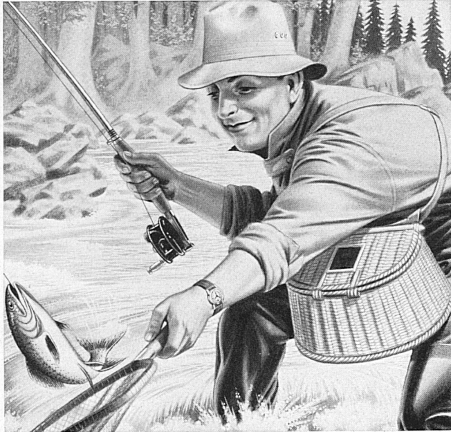
La truite, reine des rivières; Doxa, reine des montres