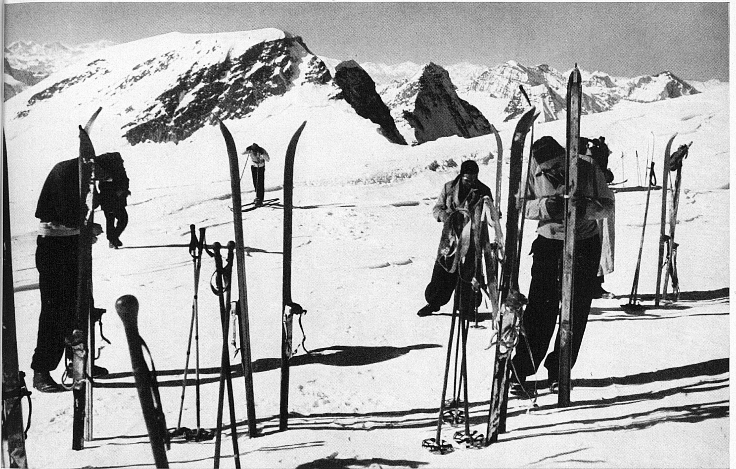
Oben: Auf die Ebnefluh führt eine lohnende Frühlingskitour vom Jungfrauoch aus. Blick gegen Breithorn-Balmhorn. Ci-dessus: Un excellent itinéraire de randonnée à ski mène du Jungfrauoch à l'Ebnefluh. Vue sur le Breithorn-Balmhorn.