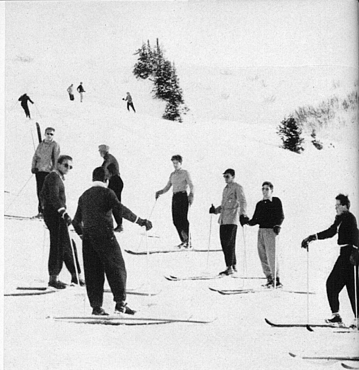
Ci-dessus: Les directeurs de l'Ecole suisse de ski s'entraînent avant le début de la saison. — Oben: Die Leiter der Schweizer Skischulen trainieren sich auf die Saison.