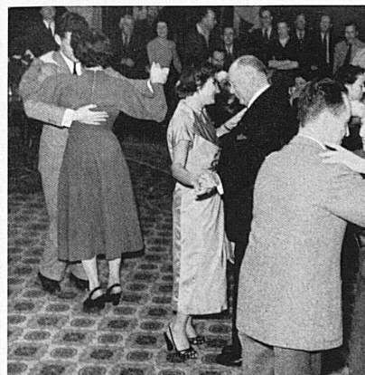
Ci-dessus: Après-ski. Les heures d'entraînement intensif se résolvent en joyeuse détente. Oben: Après-Ski! Die Stunden harten Trainings und eifrigen Skischulbetriebs münden in fröhliche abendliche Unterhaltung.