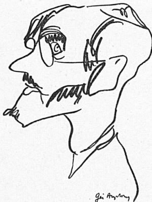
Hermon Ould (Angleterre)