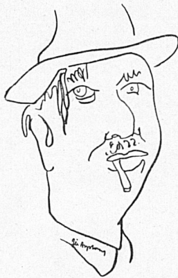
Max Deauville (Belgique)